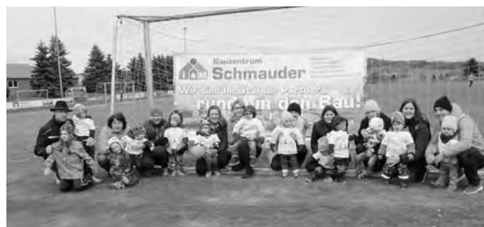
Die Eltern und Kinder des Spielkreises „Krabbelzwerge“

Am 5. Mai 2019 fand im Burgstadion in Udingen der 1. Sonnenbühler Spendenlauf des Fördervereins „familienfreundliches Sonnenbühl“ statt. Unter dem Motto „1,2,3 im Sauseschritt rennen alle Krabbelzwerge mit“ nahmen auch die Spielkreiskinder „Krabbelzwerge“ aus Genkingen an diesem Lauf teil. Jedes Kind bekam im Vorfeld von der Firma Schmauder ein tolles T-Shirt mit seinem Namen geschenkt. Von daher war die Motivation groß. Dies führte dazu, dass unsere Kinder insgesamt 78 Kinderrunden liefen. Am Ende bekam jedes Kind natürlich noch eine Ehrenurkunde. Ein herzliches Dankeschön gilt der Firma Schmauder für die tolle Unterstützung der T-Shirts und die sehr großzügige Geldspende, die dem Förderverein zu Gute kam.